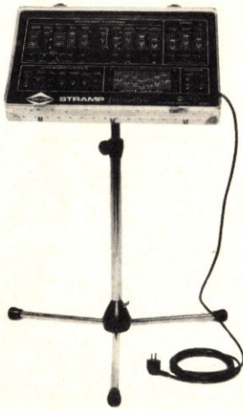
SYN-2 auf Stativ ST-2 SYN-2 on Stand ST-2