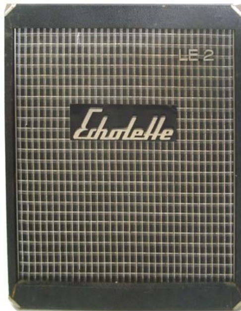
LE 2 / S LE 2 / H

Die LE 2 ist die erste Gesangsbox von Echolette. Ein 30-cm Orchesterlautsprecher und eine über eine Frequenzweiche betriebene Kombination aus einem Mittelton-Exponentialhorn sowie zwei dynamische Hochtönern verleihen dieser Box einen exzellenten Klang. Ab 1968 wurde diese Box dann im modernisierten Gewand der neuen Silberserie von Echolette angepasst.