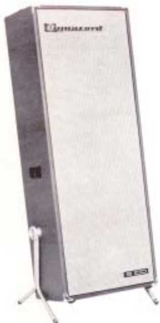
1. Modell bis 1967