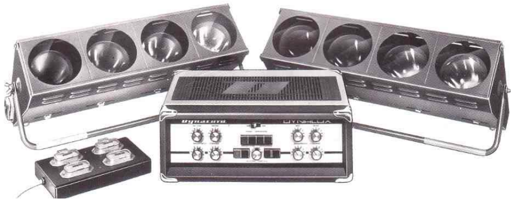
DYNALUX mit 2 x DCL 4 und Verteilerkasten LSVK

Das Gerät DYNALUX ist eine Lichtsteueranlage zur frequenzabhängigen Steuerung einer vierfarbigen Lichtquelle. Die Steuerung kann wahlweise automatisch oder auch manuell durch die Betätigung der verschiedenen Drucktastenschalter erfolgen. Das Gerär verfügt über vier Steuerkanäle mit je zwei getrennten Empfindlichkeitsstellern. Je Kanal kann eine oder mehrerer Lichtquellen von insgesamt 880 Watt angeschlossen werden. Passend zum DYNALUX gibt es u.a. den Vierfarben-Lichtwerfer DLC 4 mit je einem farbigen Leuchtmittel (rot, gelb, grün und blau) mit einer Leistung von 100 Watt.