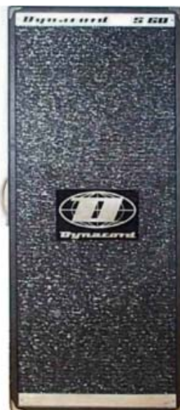
2. Modell ab 1969